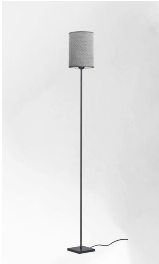
KAWA en bronze griffé avec abat-jour en Parma Cendré (tissu de catégorie 4)