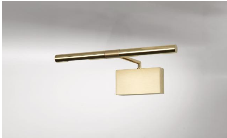
MEROE 25 en laiton (poli et satiné) (option) Finitions du métal : code 20