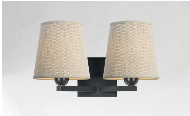
SECHAT en bronze griffé avec abat-jour en Parma Merisier (tissu de catégorie 4)