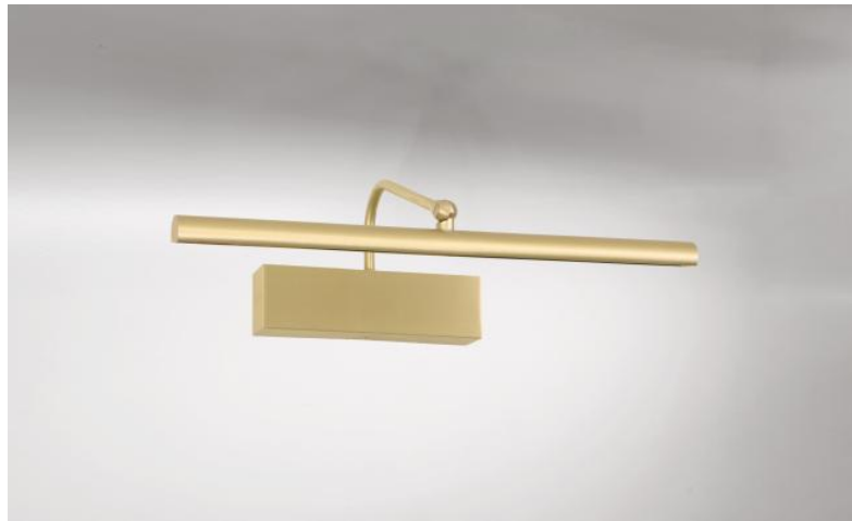
VERSAILLES 35 en laiton satiné. Finition du métal : code 25