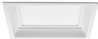
90 Blanco Técnico / Technical White / Blanc Technique