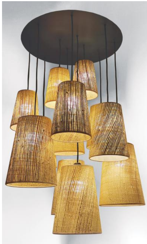
SIMBA 12 o58 en bronze griffé avec abat-jour en Raphia Nature et Raphia Banane (matières de catégorie 3)