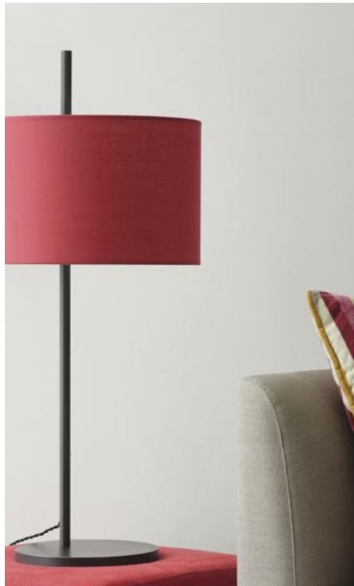
MENDES en bronze griffé avec abat-jour en Coton Groseille (tissu de catégorie 1)