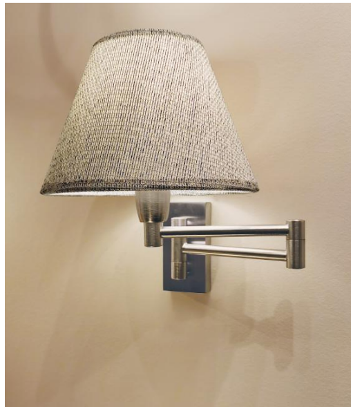
MAMMISI en nickel satiné avec abat-jour en Esmaria Avoine (tissu de catégorie 3)